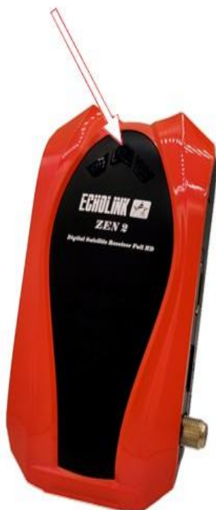
Bouton 'Marche/Arrêt' du récepteur